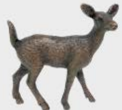
947 Hjortedyr – Bronse 8 x 8,5 x 3,5 cm