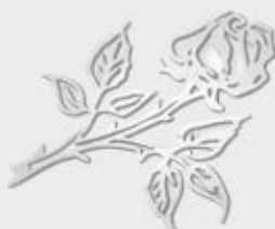
20 877 – Børstet stål Høyde 9 cm, bredde 7 cm