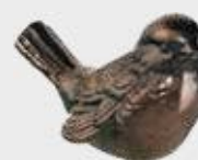
535 Bredde 11 cm