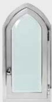
07748001 – Polert Stål Høyde 25 cm, bredde 12 cm