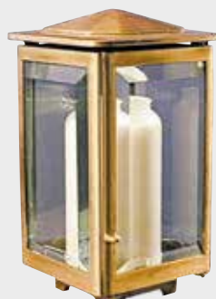
1004 - M12