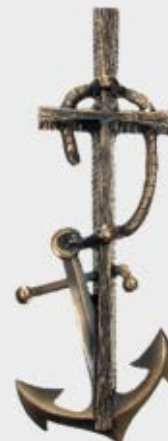
365 Høyde 36 cm