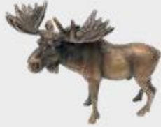
991 Elg – Bronse 12 x 9,5 x 7 cm