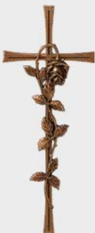
* P 23 577 Høyde 40 cm