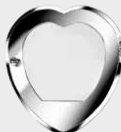
0731 – Polert Stål Høyde 20 cm, bredde 18 cm