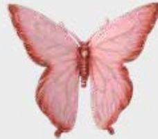
7618 Rosa Høyde 7,5 cm, bredde 8 cm