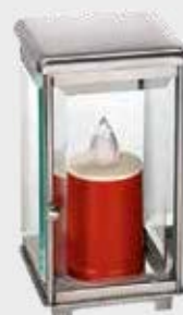
T 68 010 – Polert stål Høyde 22 cm, bredde 12 cm