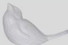
Hvit / Svart