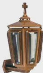
P 10 001

Høyde 21 cm, bredde 12 cm Fåes også i svart og hvitlakkert