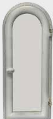
702 914 QW – Hvit Høyde 32 cm, bredde 14 cm