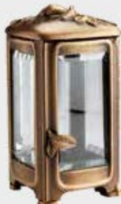
T 4497 M Høyde 20 cm, bredde 11 cm