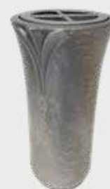
T 4341 – Alufarget bronse Høyde 19 cm, bredde 10 cm