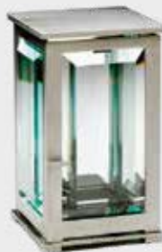
T 0134 SAT 1 – Børstet stål Høyde 18 cm, bredde 11 cm