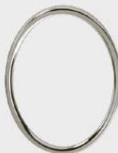
P 71 III – Polert Stål Oval / Rektangulær Høyde 12 cm, bredde 9 cm