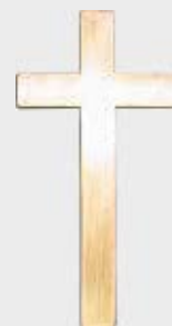
1041 E – høyde 8 cm, bredde 4 cm 1041 F – høyde 10 cm, bredde 5 cm Leveres lys lakkert