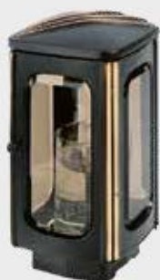
T 168.7 – Svart / Bronse Høyde 22 cm, bredde 11 cm