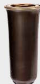
4163 VB Høyde 19 cm