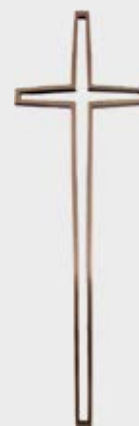
903 Høyde 35 cm