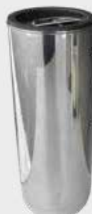
490 223 – Polert stål Høyde 24 cm