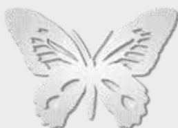
20 864 – Børstet stål Høyde 9 cm, bredde 7 cm