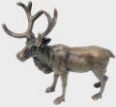
992 Reinsdyr – Bronse 12 x 12 x 5 cm