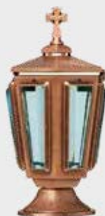
T 10 012

Høyde 21 cm, bredde 12 cm Fåes også i svart og hvitlakkert