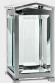
T 0119 SAT – Børstet stål Høyde 18 cm, bredde 10 cm