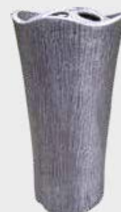
2800 – Aluminium Høyde 19 cm