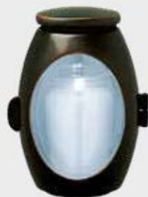
T 10 318 Classic P 10 305 Classic