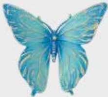
7618 Blå Høyde 7,5 cm, bredde 8 cm