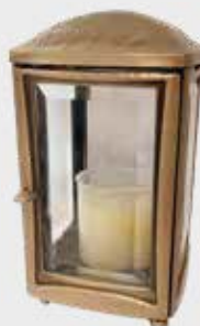
4703 Høyde 19 cm