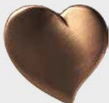
P 32 558 Høyde 8 cm, bredde 8 cm Høyde 9 cm, bredde 9 cm Høyde 10 cm, bredde 10 cm