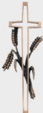
362 – høyde 40 cm * 363 – høyde 35 cm 364 – høyde 30 cm