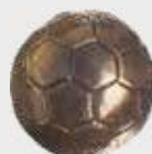
99 308 Diameter Ø 4,5 cm