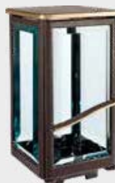
42 470 VB Høyde 22 cm