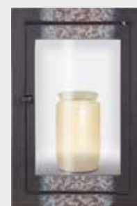
40 299 – Integrert Høyde 25 cm, bredde 16 cm