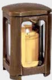
40 116 Høyde 17 cm