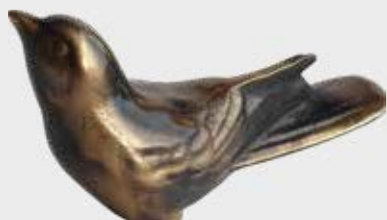
850 – Forniklet 850 – Bronse 9 x 6 x 3,5 cm