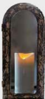
2001 Høyde 32 cm, bredde 14 cm