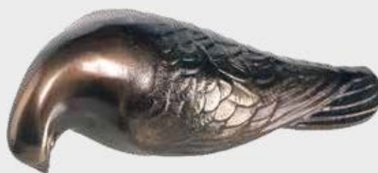
DUE 305 – 12 cm