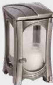
T 167.2 – Aluminium Høyde 17 cm, bredde 10 cm