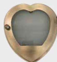
0731 – Bronse Høyde 20 cm, bredde 18 cm