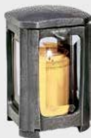
40 116 - Aluminium Høyde 17 cm