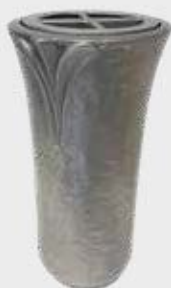
T 4341 – Alufarget bronse Høyde 19 cm, bredde 10 cm