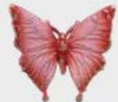
7619 Rosa Høyde 4 cm, bredde 5,5 cm