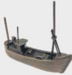
990 Båt – Bronse 11,5 x 10,5 x 3 cm