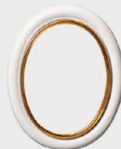
P 19 534 Høyde 15 cm, bredde 11 cm Høyde 12 cm, bredde 9 cm