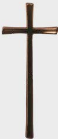
P 23 338 Høyde: 40 / *30 / 20 cm