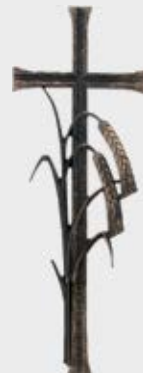
380 – høyde 27 cm 381 – høyde 35 cm