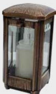
LB 105 N Høyde 19 cm