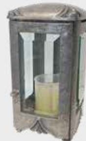
T 4340 – Alufarget bronse Høyde 20 cm, bredde 11 cm