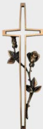
371 – høyde 35 cm 370 – høyde 40 cm