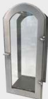
103 – Aluminium Høyde 32 cm, bredde 14 cm