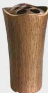
2500 Høyde 19 cm

En fuktig klut er ofte tilstrekkelig til å fjerne lett smuss, fingeravtrykk og lignende.