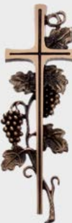
858 B Høyde 35 cm