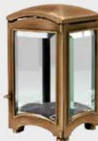
T 4056 M