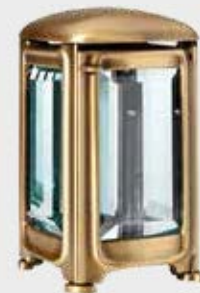
T 4468 M