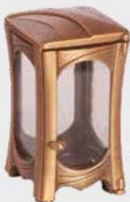
T 167.1 Høyde 17 cm, bredde 10 cm