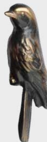
852 – Forniklet 852 – Bronse 10 x 4 x 3,5 cm