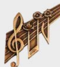
P 31 082 Høyde 6 cm, bredde 8,5 cm