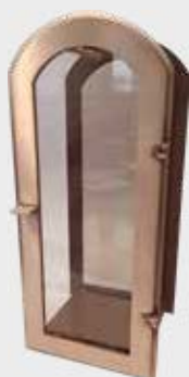
101 – Bronse Høyde 32 cm, bredde 14 cm