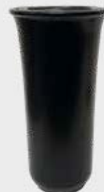
T 4163 – Svart Høyde 19 cm, bredde 10 cm