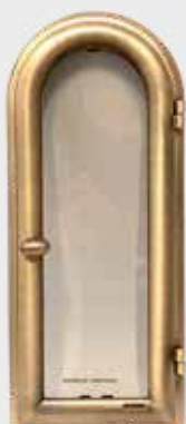
702 914 Høyde 32 cm, bredde 14 cm