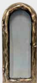
1001 Høyde 32 cm, bredde 14 cm