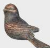
85 328 H Høyde 4 cm