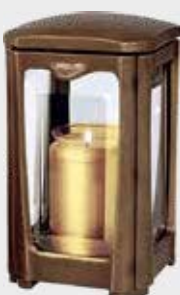
40 117 Høyde 21 cm