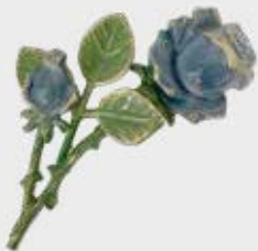
29351 – Blå Høyde 14 cm