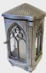
1449 – Aluminium Høyde 20 cm