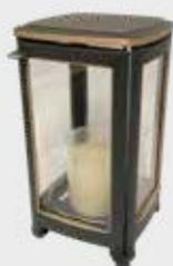
454503 QG - Brun Høyde 17,5 cm