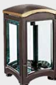
4056 VB Høyde 20 cm