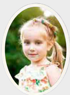
PORSELENSBILDE Oval, hvit kant Høyde 12 cm, bredde 9 cm