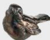
536 Bredde 11 cm