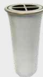
5214 QW - Hvit Høyde 19 cm