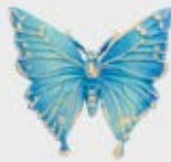
7619 Blå Høyde 4 cm, bredde 5,5 cm