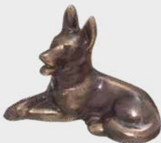
99 021 – Helfigur Høyde 6,5 cm, bredde 5,5 cm, lengde 10 cm