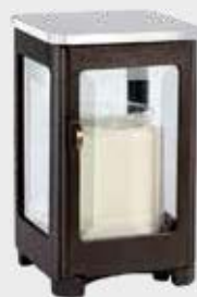
40 265 Mørk bronse m/ståltopp Høyde 16 cm