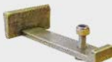
1922 – Aluminium 1912 – Bronse