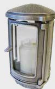
1400 F – Aluminium Høyde 20 cm