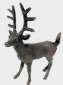
946 Hjortedyr – Bronse 12 x 9 x 5 cm

Reinsdyr, Elg, båt og motorsykel er resultat av 3D-scanning. Originalen vil bli sendt i retur sammen med bronsedekoren. Siden dette er skreddersøm vil pris avtales.