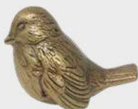
1402 – Lys bronse 1402/M – Mørkere Høyde 5,5 cm, bredde 4,5 cm