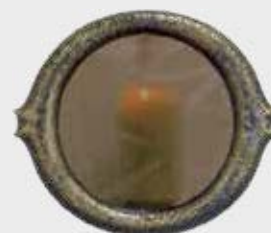
10 066 Diameter Ø 18 cm