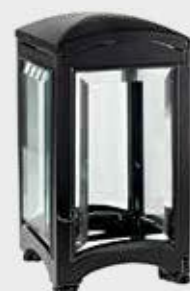
T 4056 MTB – Svart Høyde 19 cm, bredde 11 cm