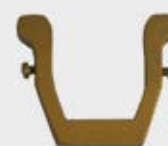
P 90 902

Høyde 21 cm, bredde 12 cm Fåes også i svart og hvitlakkert