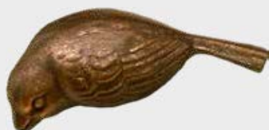
447 Høyde 3,5 cm, bredde 9 cm