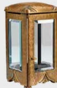
T 4340 M Høyde 20 cm, bredde 11 cm