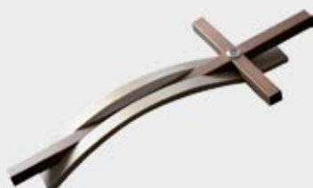
51 III s.1 Høyde 25 cm Bronse