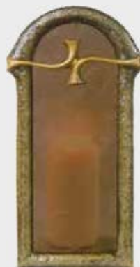
10 060 Høyde 32 cm, bredde 16 cm