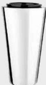
T 60 740 – Polert stål Høyde 20 cm, bredde 11 cm