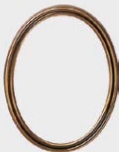
P 19 377 – Gull / hvit / sort Oval / Rektangulær Høyde 15 cm, bredde 11 cm Høyde 12 cm, bredde 9 cm Høyde 10 cm, bredde 8 cm Høyde 9 cm, bredde 7 cm