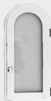
072 912 – Polert Stål Høyde 25 cm, bredde 14 cm