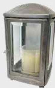
4703 – Alufarget bronse Høyde 19 cm