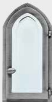
70748001 A – Aluminium Høyde 25 cm, bredde 12 cm