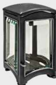
T 4056 AD – Mørk aluminium Høyde 19 cm, bredde 11 cm