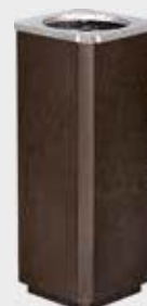
53 208 Med ståltopp Høyde 19 cm