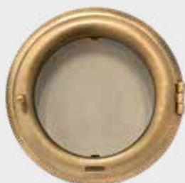
702 818 Diameter Ø 18 cm