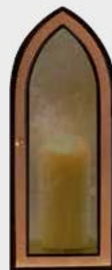
10 067 Høyde 33 cm, bredde 14 cm