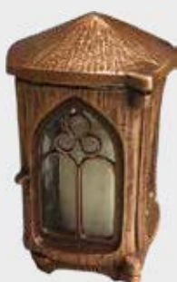
1049 W Høyde 20 cm