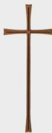
P 23 533 Høyde: 40 / *30 / 16 / 10 cm