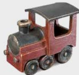
85 291 – Helfigur Høyde 8 cm, bredde 5 cm, lengde 10 cm