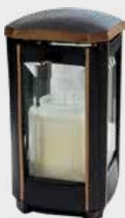
LB 105 C Høyde 19 cm