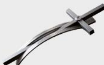
51 III sda.2 Høyde 25 cm Aluminium