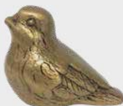
1404 – Lys bronse 1404/M – Mørkere Høyde 5,5 cm, bredde 4,5 cm