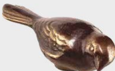
469 Høyde 3,5 cm, bredde 11,5 cm