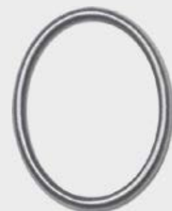
P 20 557 – Aluminium Oval / Rektangulær Høyde 12 cm, bredde 9 cm