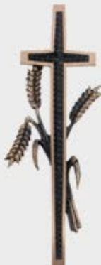
369 – høyde 30 cm 384 – høyde 35 cm 385 – høyde 40 cm