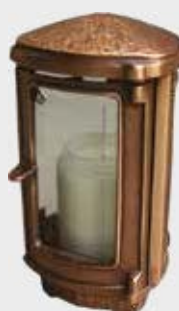
1000 F Høyde 20 cm