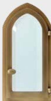
70748001 – Bronse Høyde 25 cm, bredde 12 cm