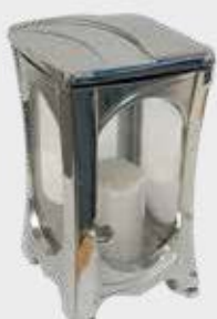
2702 / FN – Krom Høyde 17 cm, lys 2,5 døgn Fåes også i svart og hvitlakkert