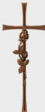
* P 23 599 Høyde 30 cm