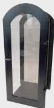
102 – Mørk bronse Høyde 32 cm, bredde 14 cm