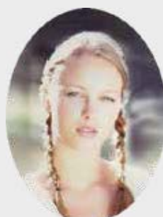
PORSELENSBILDE Oval Høyde 12 cm, bredde 9 cm