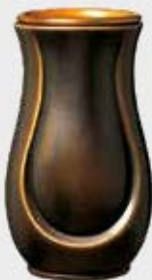
T 5987 Classic