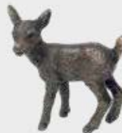
948 Hjortedyr – Bronse 5 x 4,5 x 2 cm