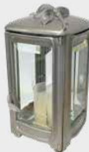
T 4497 – Alufarget bronse Høyde 20 cm, bredde 11 cm