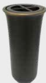
5213 QG - Brun Høyde 19 cm