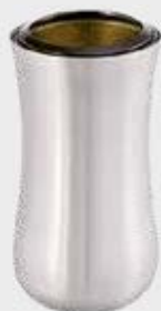
T 0800 – Børstet stål Høyde 20 cm, bredde 12 cm