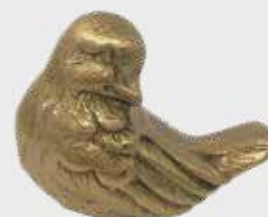
1407 – Lys bronse 1407/M – Mørkere Høyde 5,5 cm, bredde 4,5 cm