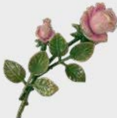
29351 – Rosa Høyde 14 cm