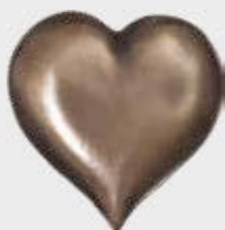
99 430 – høyde 7 cm, bredde 7,5 cm 99 430 A – høyde 4,5 cm, bredde 4,5 cm 99 431 – høyde 3 cm, bredde 3 cm Forniklet / Aluminium / Bronse