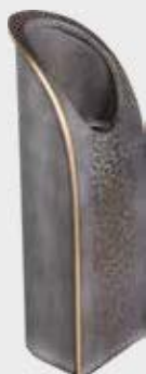
53 142 Høyde 30 cm