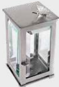
T 0134 SAT 4 – Børstet stål Høyde 18 cm, bredde 11 cm