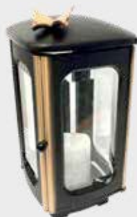
T 188-9R – Svart / Bronse Høyde 23 cm, bredde 11 cm