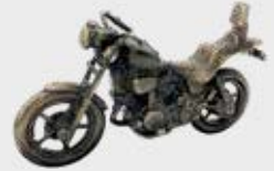
973 Motorsykel – Bronse 16 x 9 x 5,5 cm