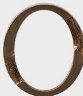
P 19 275 Høyde 15 cm, bredde 11 cm Høyde 12 cm, bredde 9 cm