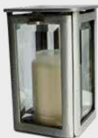
152 / ALU – Aluminium Høyde 17 cm