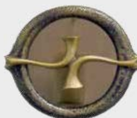
10 062 Diameter Ø 18 cm