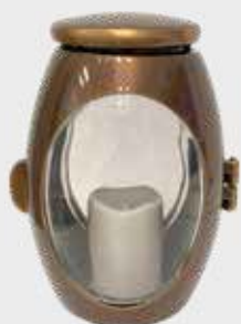
T 10 316 P 10 303