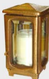
1521 F Høyde 19 cm