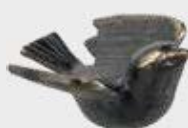
221 Bredde 9 cm