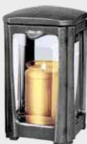
40 117 - Aluminium Høyde 21 cm