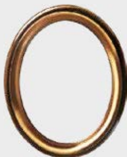
P 19 787 Høyde 15 cm, bredde 11 cm Høyde 12 cm, bredde 9 cm