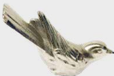
851 – Forniklet 851 – Bronse 7 x 10 x 3,5 cm