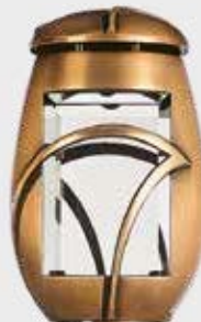
T 10 090