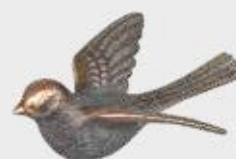
37 138 Høyde 3 cm