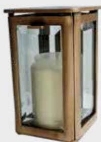
152 Høyde 17 cm