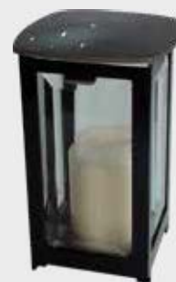
405 DM / S Med krystaller Høyde 19 cm