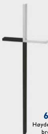
62 588 Høyde 30 cm Mørk bronse / stål