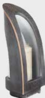
40 191 Høyde 27 cm