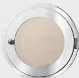
072 818 – Polert Stål Diameter Ø 18 cm