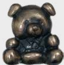
99 171 – Relief / helfigur Høyde 9,5 cm, bredde 10 cm, lengde 4 cm