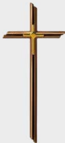
P 24 237 Høyde: 40 / *30 cm