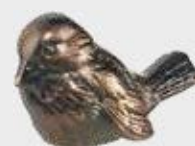
534 Bredde 11 cm