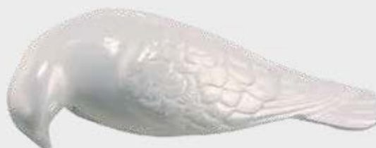
DUE 305 – 12 cm hvit brennlakkert