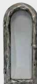
1001 / ALU Høyde 32 cm, bredde 14 cm