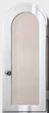
072 914 – Polert Stål Høyde 32 cm, bredde 14 cm