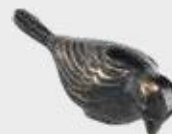
226 / Ned Bredde 9 cm