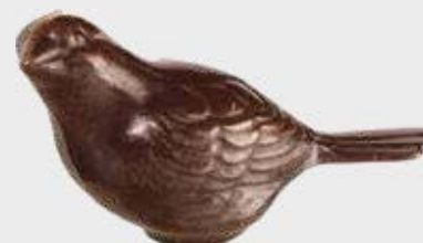
470 Høyde 5,5 cm, bredde 12 cm