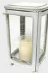
454503 QW - Hvit Høyde 17,5 cm