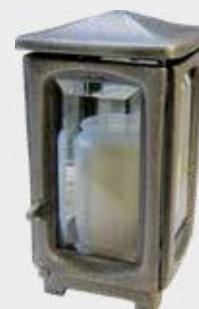
1621 F – Aluminium Høyde 19 cm