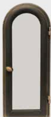
702 914 QG Høyde 32 cm, bredde 14 cm