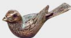
85 368 Høyde 4 cm