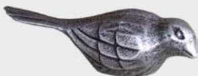
9727 – Aluminium Lengde 11 cm