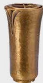
T 4341 Høyde 19 cm, bredde 10 cm