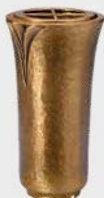
T 4341 Høyde 19 cm, bredde 10 cm