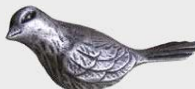
9728 – Aluminium Lengde 11 cm