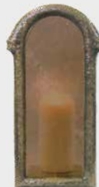
10 064 Høyde 32 cm, bredde 16 cm