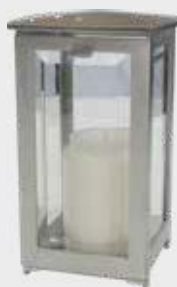
405 D / S Børstet stål med krystaller Høyde 19 cm