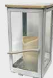
5403 QW - Hvit Høyde 22 cm