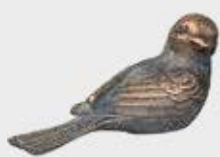
85 328 V Høyde 4 cm