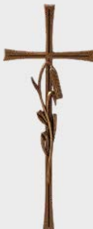
* P 23 613 Høyde 40 cm