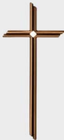
P 24 215 Høyde: 40 / *30 cm